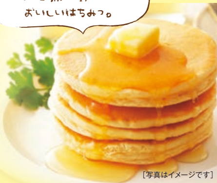
[写真はイメージです]