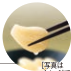
[写真はイメージです]