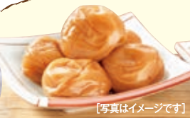
[写真はイメージです]