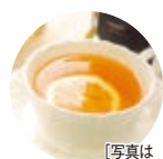
[写真はイメージです]