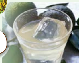
[写真はイメージです]