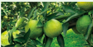
[写真はイメージです]